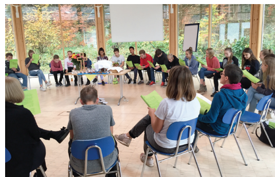
Konfirmanden/innen haben große Freude auf der Freizeit.