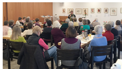
Frauenfrühstück – eine von vielen Veranstaltungen im großen Saal.