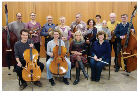
Das Kammerorchester, eine unserer Musikgruppen.