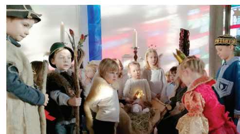
Die Jüngsten spielen die Geburt Jesu.