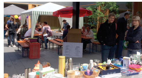
Der Innenhof des Gemeindezentrums beim Gemeindefest.

1. Abzahlung des Gemeindezentrums: Im November 2016 konnten wir nun die neuen, hellen und freundlichen Räume beziehen. Durch das viele Lärchenholz im Innenbereich wirken die einzelnen Bereiche sehr wohnlich und laden zum Verweilen ein. Nichtsdestotrotz müssen wir für Zins und Tilgung unserer Restschulden in diesem Jahr 18.933 Euro aufbringen.