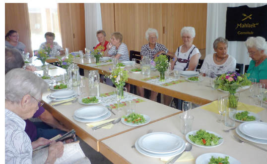
„Mahlzeit Gemeinde“ trifft sich einmal im Monat zum Kochen und Essen.

Weitere Informationen erhalten Sie auch auf unserer Homepage: www.marktschwaben-evangelisch.de