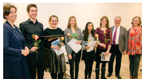
Jugendliche Mitarbeitende werden für ihr großes Engagement geehrt.