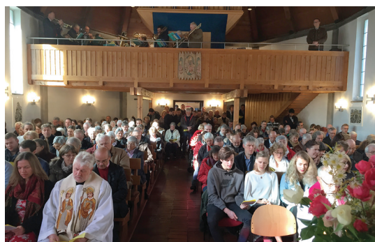
Festgottesdienst zum Reformationstag in der Philippuskirche.