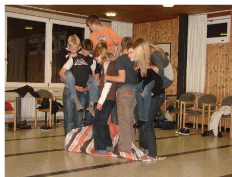
Jugendliche haben Spaß miteinander