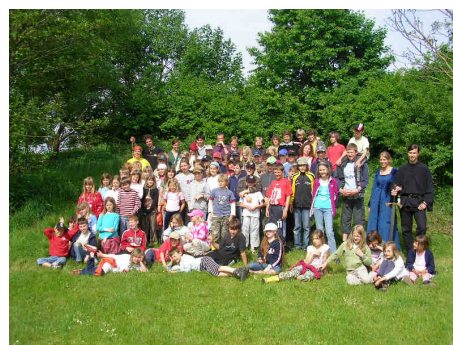
Kinder im Zeltlager