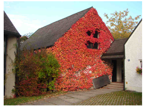
Unser Gemeindezentrum muss energetisch saniert werden

2. Energetische Sanierung des Gemeindezentrums: Obwohl wir für unser Gemeindezentrum in Markt Schwaben viel Energie verbrauchen, bringen wir unseren großen Saal im Winter nicht warm. Darum müssen wir das Gemeindehaus, das in den 70-er Jahren gebaut wurde, energetisch sanieren. Die Planungen stehen noch am Anfang, klar ist aber, dass wir sowohl im Blick auf die Energiekosten wie auf den Energieverbrauch eine Sanierung durchführen müssen. Auch hierfür benötigen wir Ihr Kirchgeld.