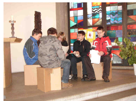
Konfirmanden gestalten den Gottesdienst

Weitere Infos erhalten Sie auch auf unserer Homepage: www.marktschwaben-evangelisch.de