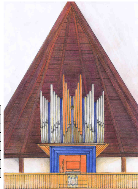
Für diese Orgel sparen wir

3. Neue Orgel für die Philippuskirche: Inzwischen hat der Kirchenvorstand einstimmig beschlossen, für welche neue Orgel wir sparen wollen. Es soll ein Werk der renommierten Firma Eule aus Bautzen sein. € 150.000 wird die Orgel kosten. Zwei Drittel benötigen wir, dass wir die Firma beauftragen können. Bisher haben wir rund € 40.000 ansparen können. Mit Ihrem Beitrag kommen wir unserem Ziel näher.